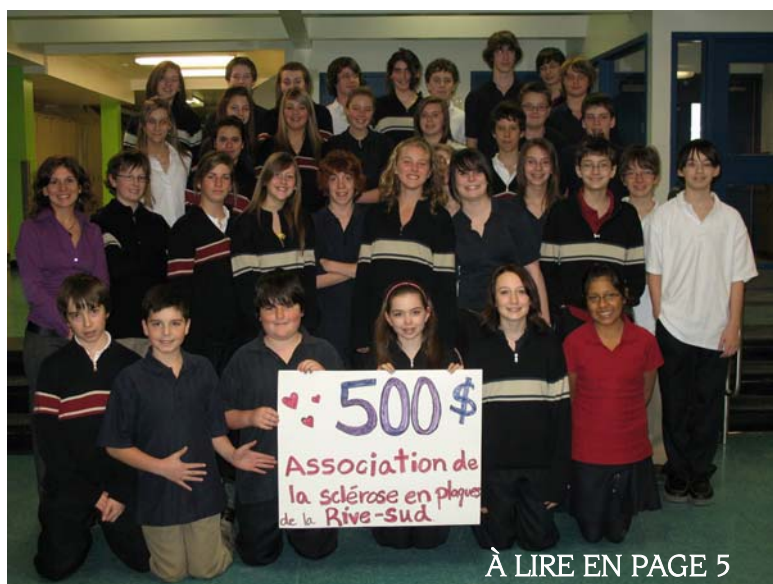
À LIRE EN PAGE 5