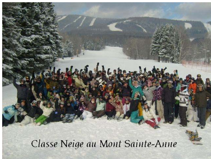
Classe Neige au Mont Sainte-Anne