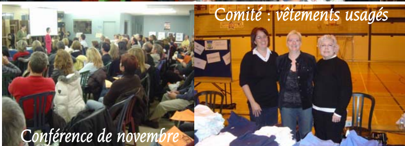
Conférence de novembre